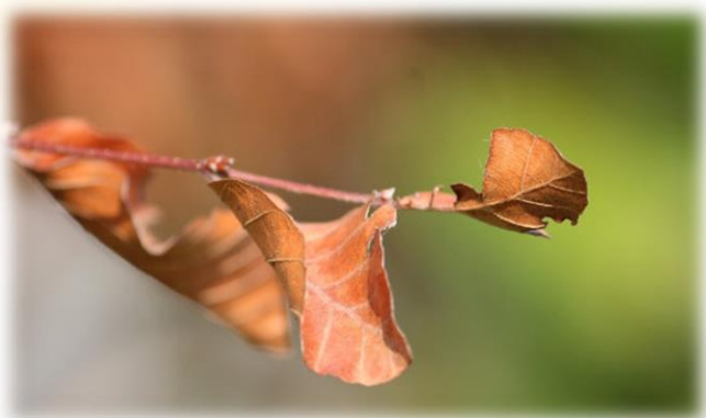
Illustration: un feuillage brun – on dirait que l'automne est déjà arrivé en août. Cependant il ne s'agit pas d'un jaunissement ordinaire mais de la réponse des arbres à la sécheresse.