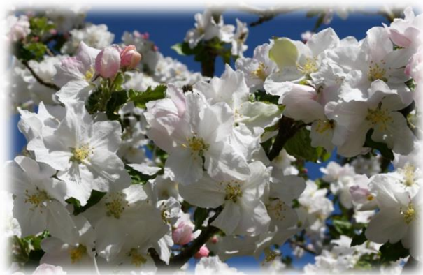
Le pommier a fleuri à partir du 14 avril 2020

Fin mars - début avril, les aiguilles des mélèzes sont apparues, tandis que les feuilles des noisetiers, marronniers, bouleaux et sorbiers des oiseleurs se sont déployées avec 2 semaines d'avance sur la norme 1981-2010.